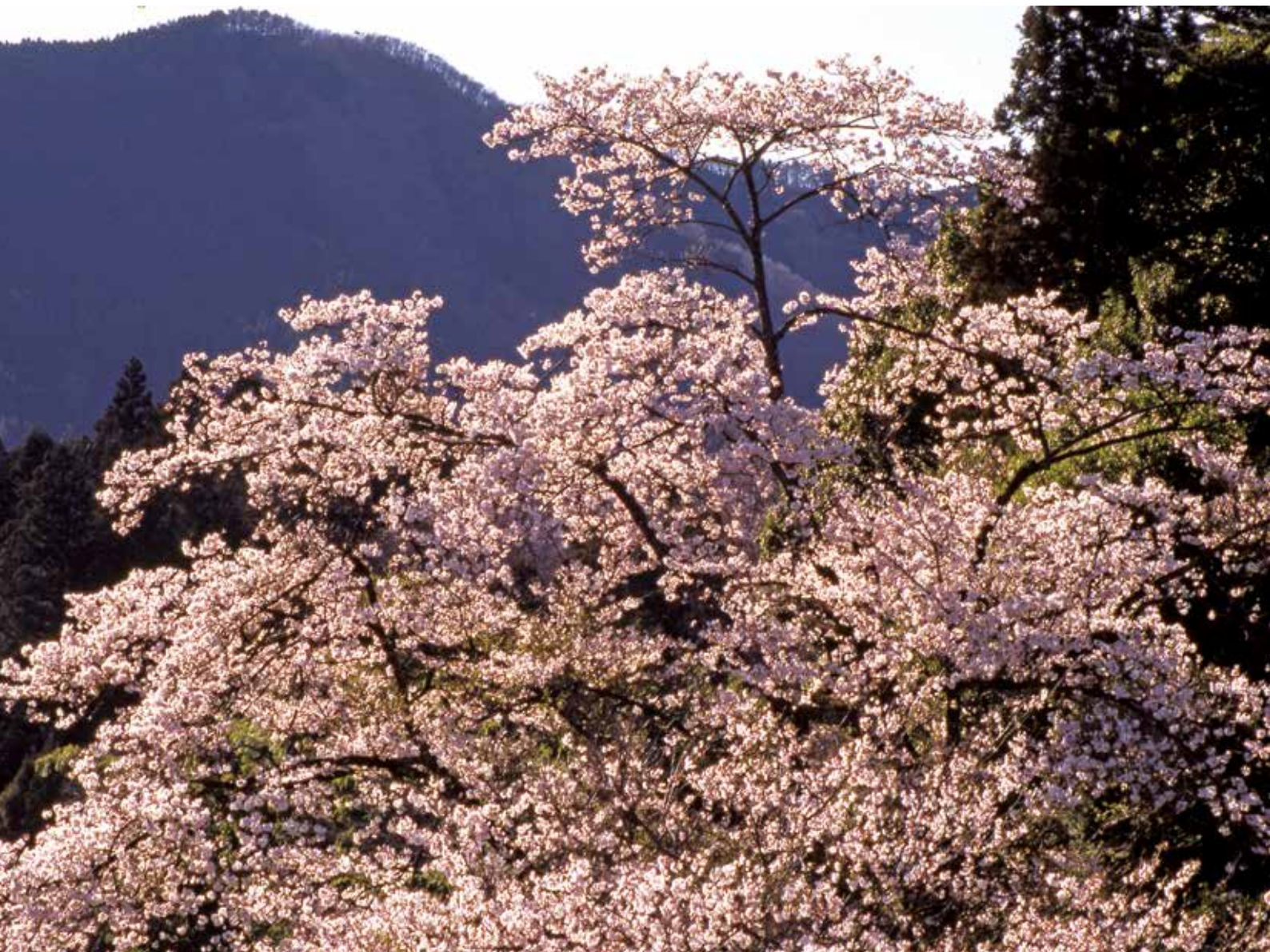
「奥久慈の桜」(撮影・太子町)