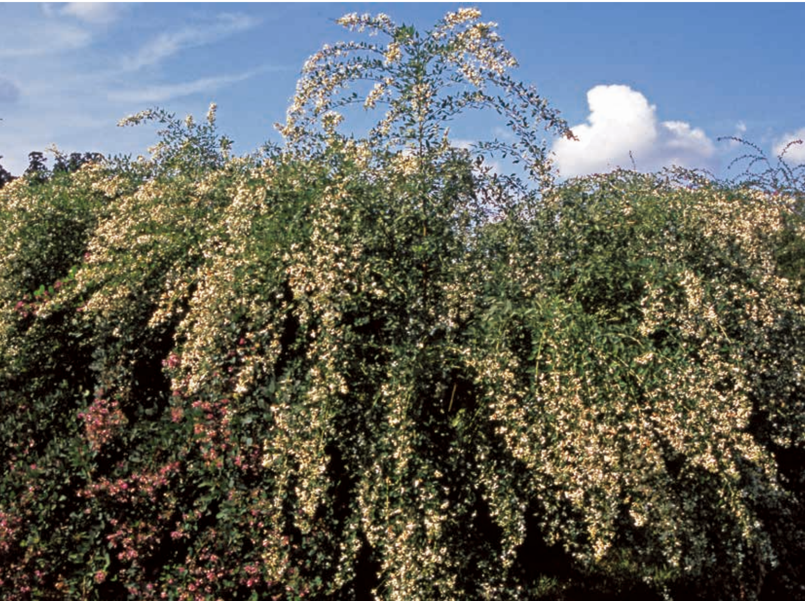
「偕楽園の白萩」(撮影・水戸市)：日本写真家協会会員 藤井 正夫