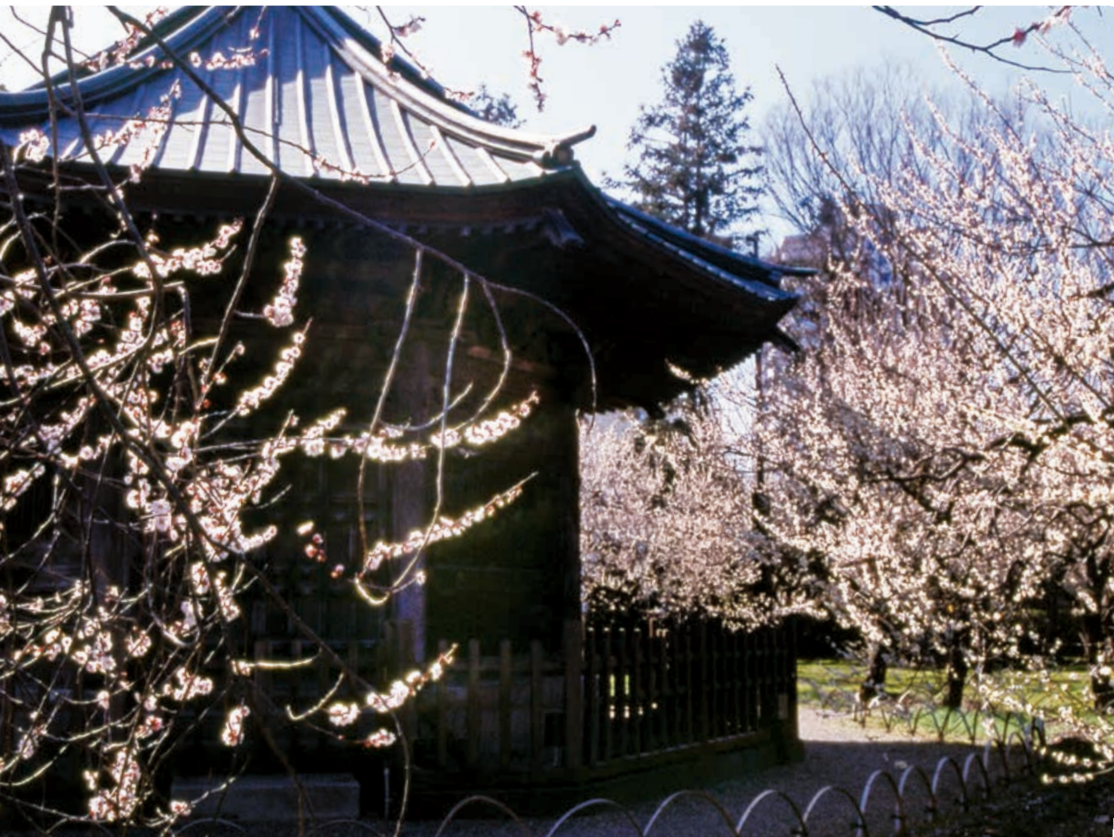
梅・咲き競う（撮影：水戸市）：日本写真家協会会員 藤井 正夫