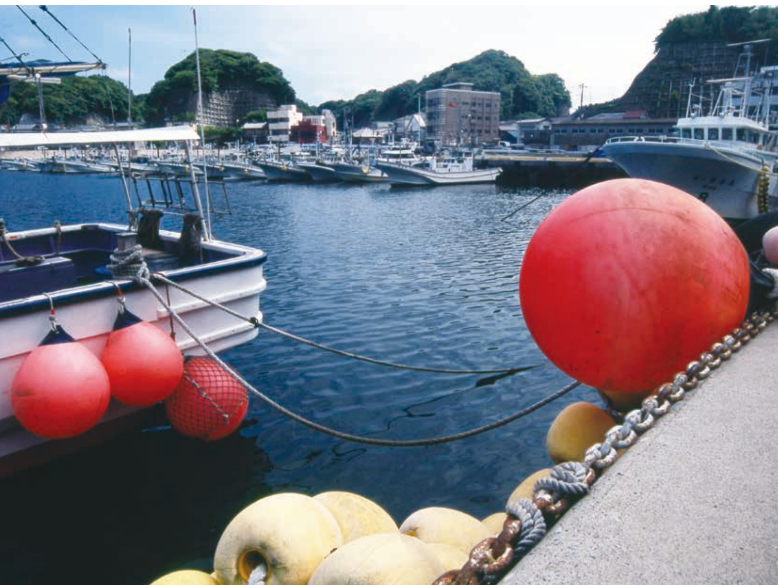
出船を待つ