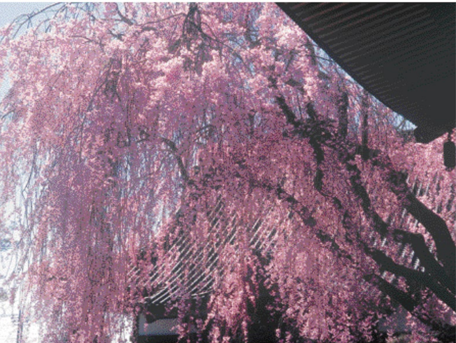
「宝蔵寺の紅しだれ桜」(撮影・水戸市)：日本写真家協会員 藤井 正夫