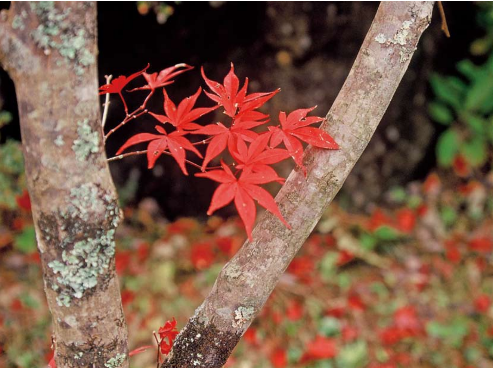
「秋の印象」(撮影・高萩市)：日本写真家協会員 藤井 正夫