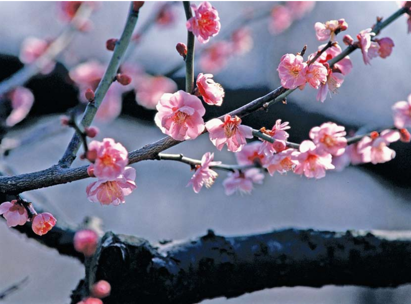
「弘道館の梅」(撮影・水戸市)：日本写真家協会員 藤井 正夫