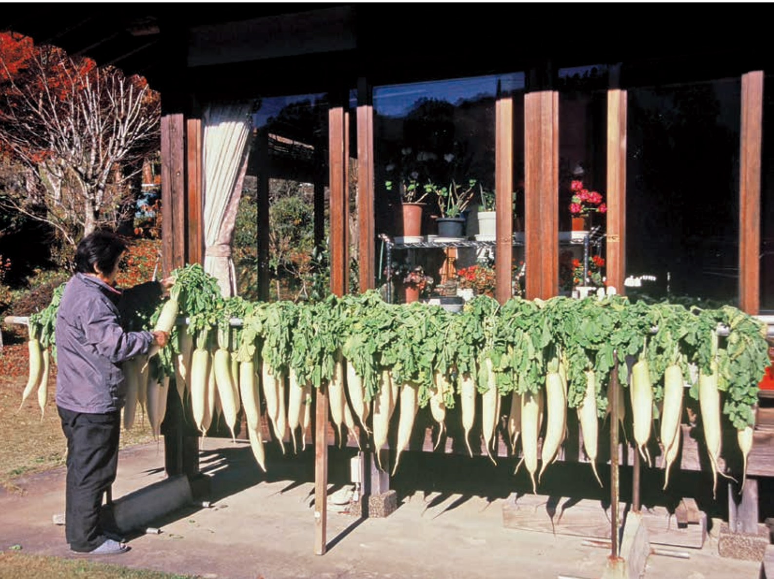
「初冬の風物詩」(撮影・高萩市)：日本写真家協会 藤井 正夫