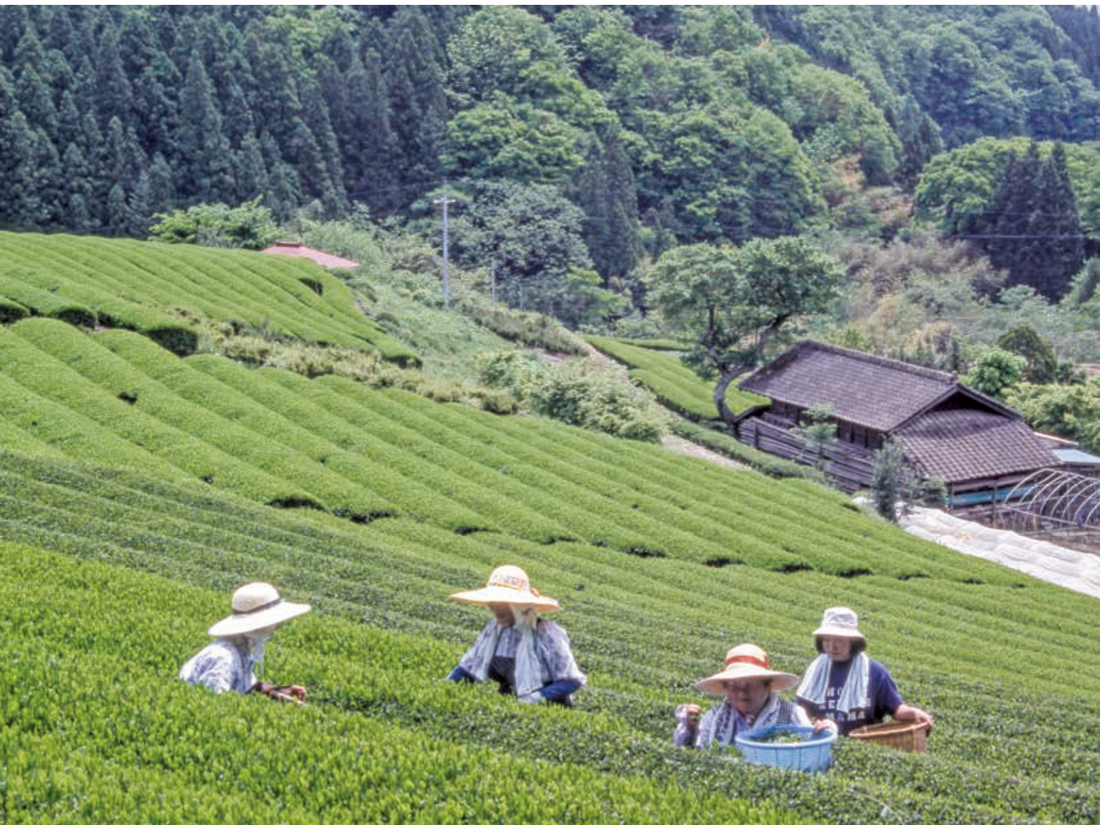
「お茶畑風景」(撮影・大子町)