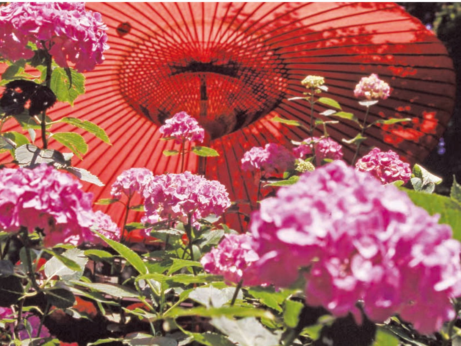
「あじさいの雨引山」(撮影・桜川市)：日本写真家協会 藤井 正夫