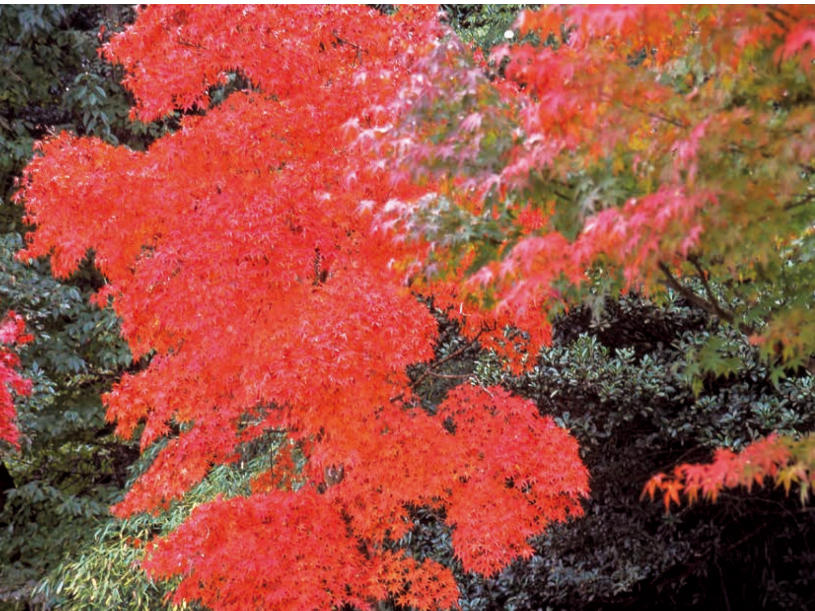
紅葉の花園溪谷