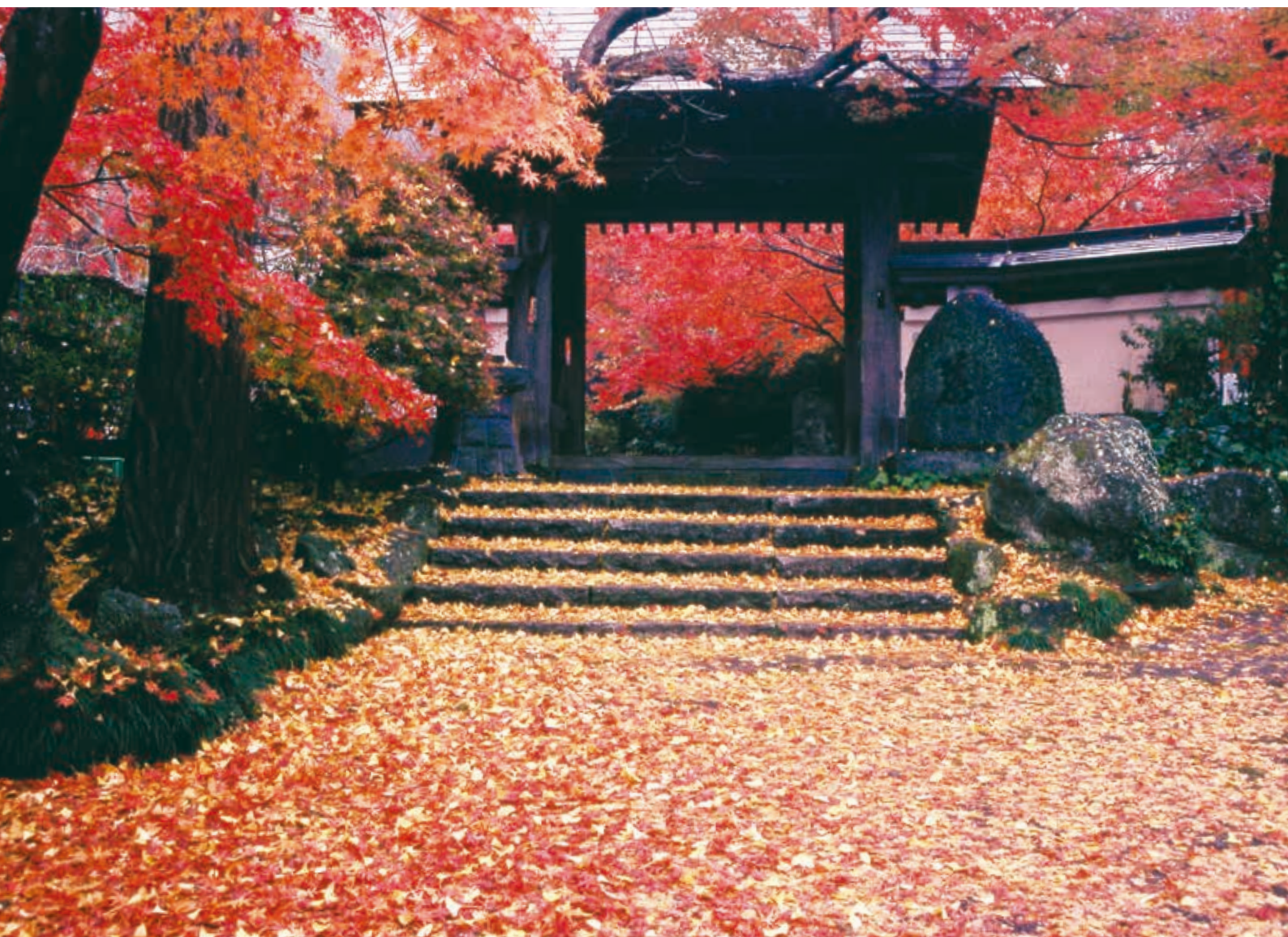
紅葉の寺（撮影：薬王寺（桜川市））：日本写真家協会 藤井 正夫