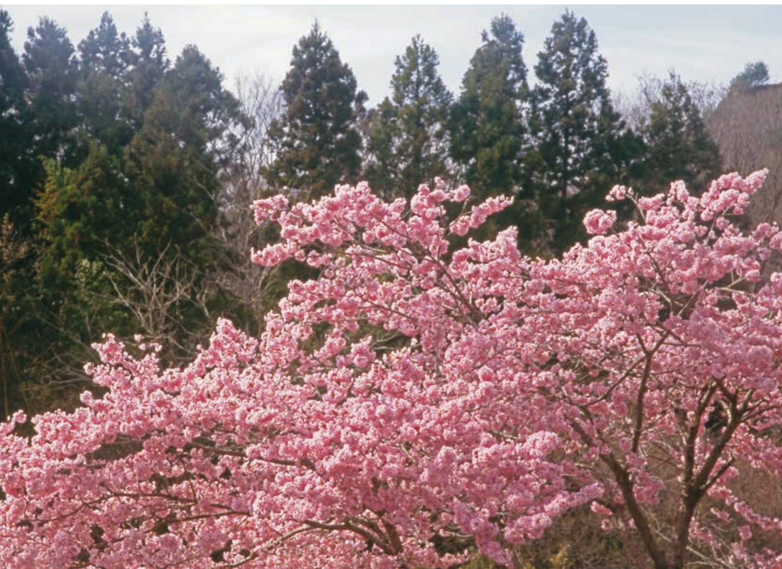
輝く桜（撮影：常陸大宮市（山方））：日本写真家協会会員 藤井 正夫