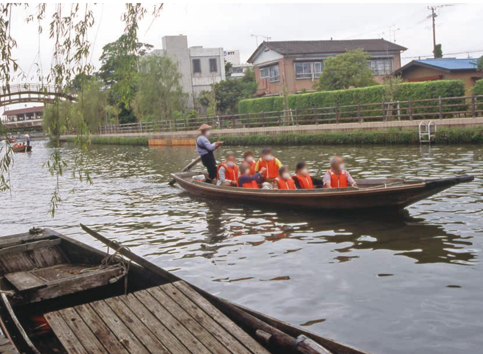
水郷風景（撮影：潮来市）：日本写真家協会会員 藤井 正夫