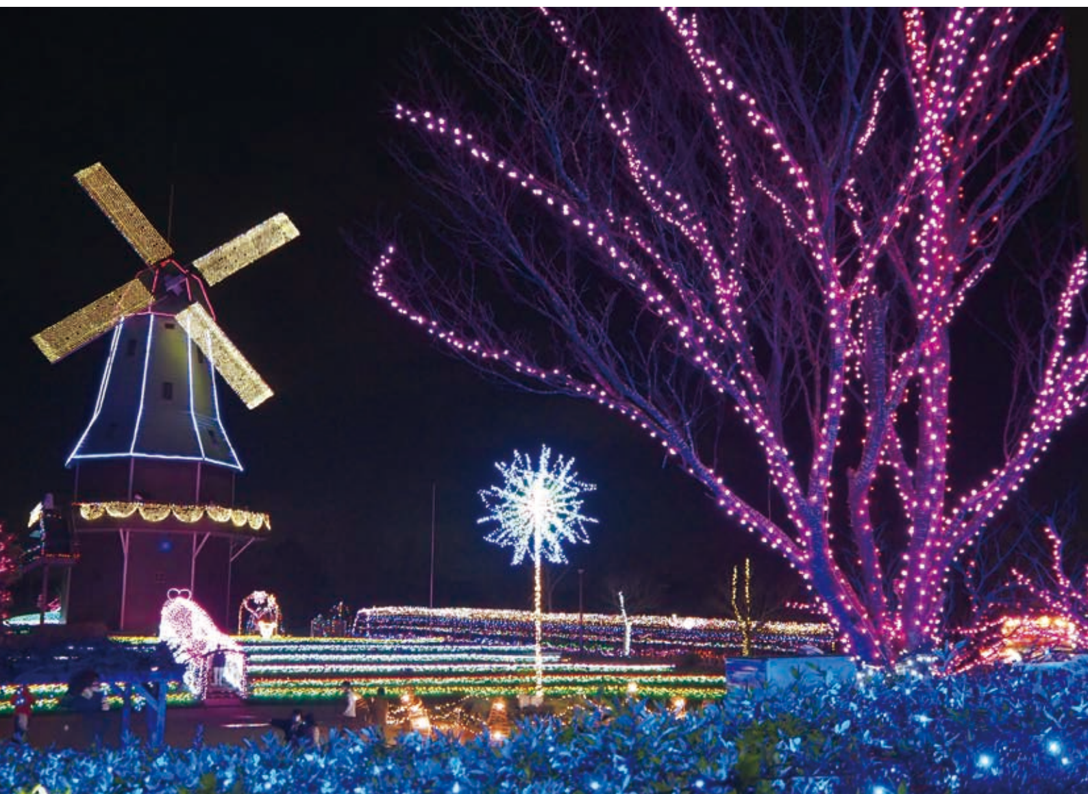
霞ヶ浦総合公園（土浦市）